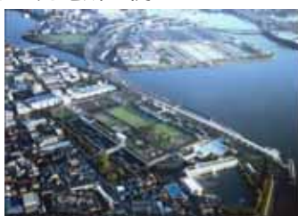
森ヶ崎水再生センターバイオマス発電設備 3,200kW