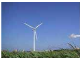
銚子屏風ヶ浦風力発電所 1,500kW