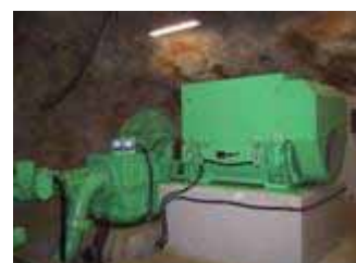
釜石鉱山マイクロ水力発電所 450kW